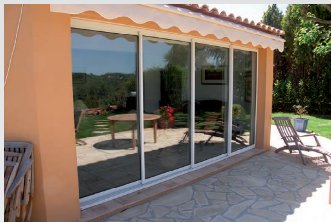
Menuiserie aluminium réalisée par un fabricant Sepalumic