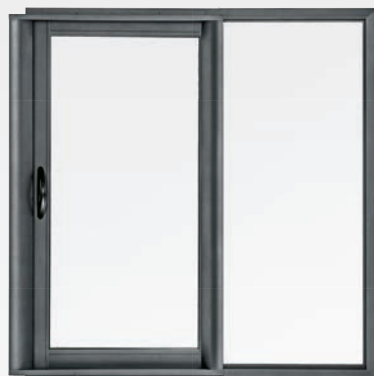
3100 LE GALANDAGE PERFORMANT