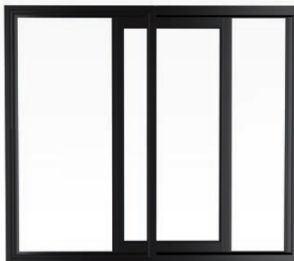
3100 COULIFIX, L'ALTERNATIVE AU COULISSANT TRADITIONNEL