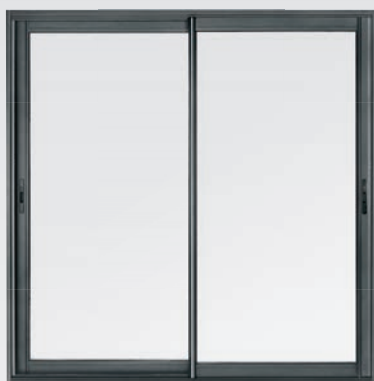
3100 LE COULISSANT 100% CRÉDIT D'IMPÔTS

LA GAMME DE COULISSANTS SEPALUMIC LA PLUS COMPLÈTE : 3 DÉCLINAISONS POSSIBLES, POUR RÉPONDRE À TOUTES LES ATTENTES :